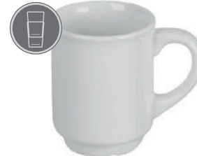
Glühwein-Becher 3 24 cl H 92 mm | Ø 76 mm