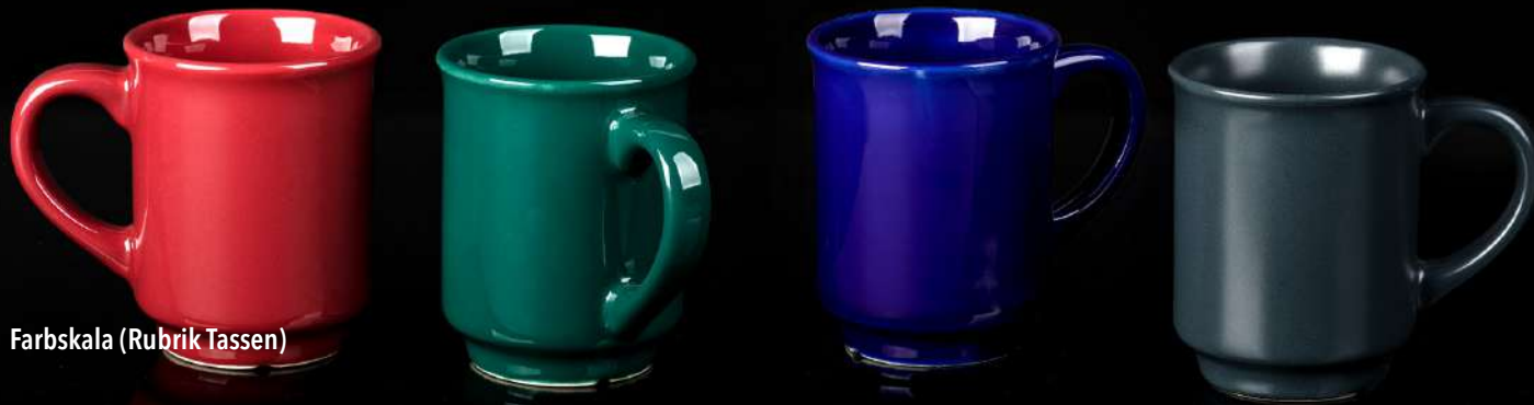
Farbskala (Rubrik Tassen)