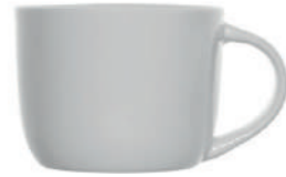
Olivia Cappuccino 28 cl H 70 mm | Ø 90 mm