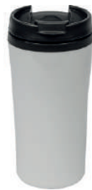
HotMaxx 8 28 cl H 164/144 mm | Ø 74 mm