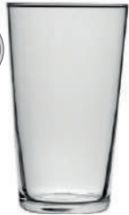
Conique 57 cl H 150 mm | Ø 90 mm