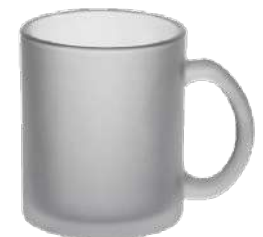
Henkelbecher satiniert 33 cl H 96 mm | Ø 80 mm