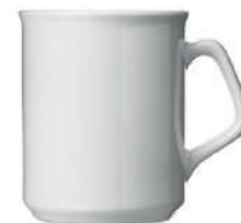
Hof 25 cl H 91 mm | Ø 80 mm