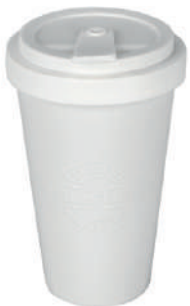
Coffee to go Clipdeckel 9 30 cl H 139 mm | Ø 90 mm