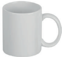
Wiesbaden 1 30 cl H 97 mm | Ø 82 mm