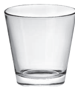
Conic 27 cl H 85 mm | Ø 85 mm