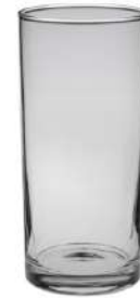
Weinstange 58 cl H 162 mm | Ø 76 mm