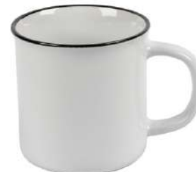
Vintage 4 35 cl H 91 mm | Ø 90 mm