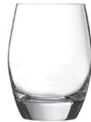
Malea 30 cl H 105 mm | Ø 77 mm