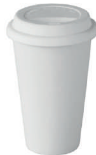
Coffee to go Silikondeckel 10 30 cl H 139 mm | Ø 90 mm