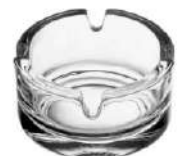
730 H 37 mm | Ø 72 mm