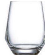
Lima 38 cl H 110 mm | Ø 88 mm