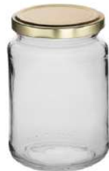
Rundglas 38 cl 15 380 ml H 112,3 mm | Ø 75,3 mm