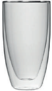
Bahia* 35 cl - Latte Macchiato H 145 mm | Ø 79 mm