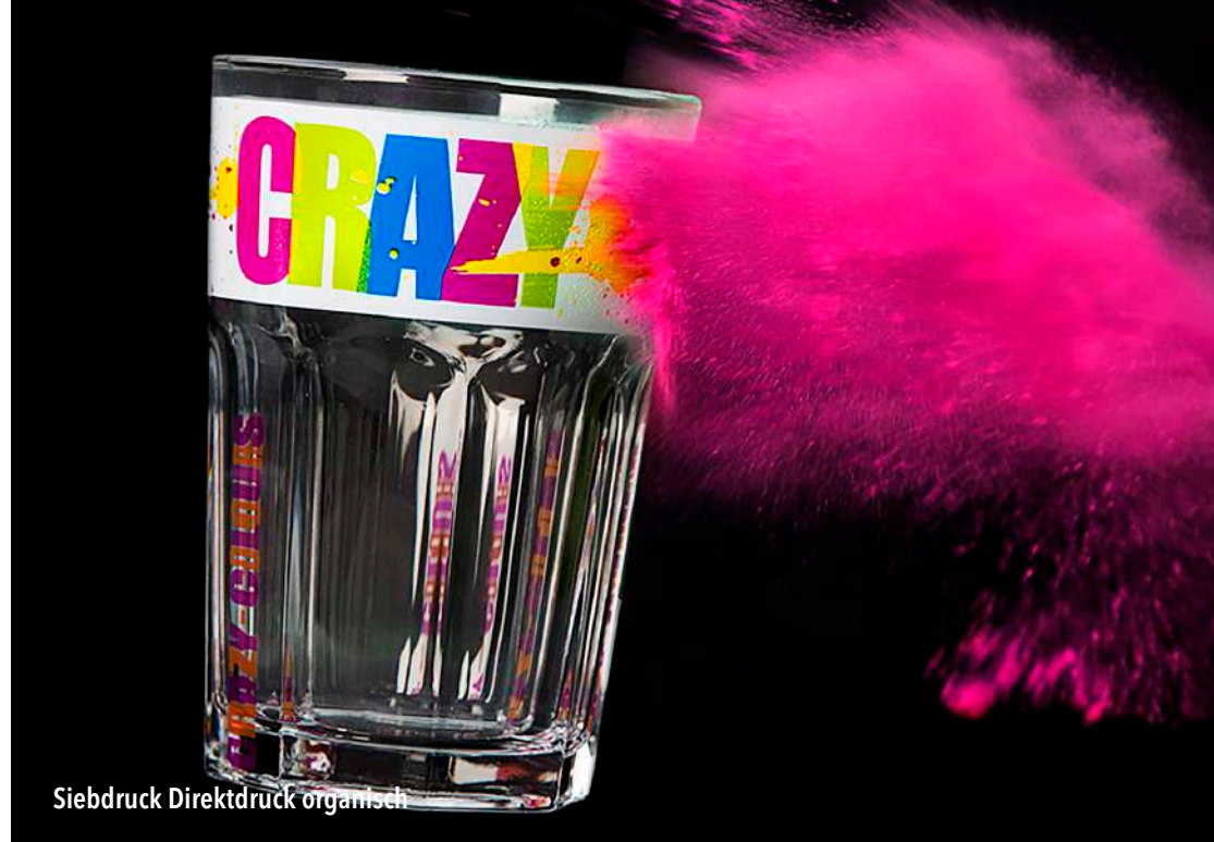
Siebdruck Direktdruck organisch