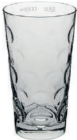
Dubbe 0,5 l H 160 mm | Ø 91 mm