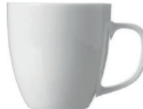
Apollo 43 cl H 100 mm | Ø 98 mm