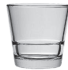
Stack Up 21 cl H 80 mm | Ø 83 mm