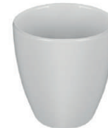
Atlanta 44 cl H 102 mm | Ø 97 mm

Tassen in den genannten Farben erhältlich, Sonderfarben und Crystal Serien auf Anfrage.