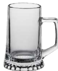
Sternboden 0,4 l H 150 mm | Ø 98 mm