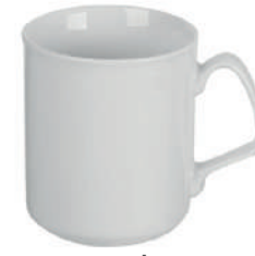
Bayreuth 32,5 cl H 95 mm | Ø 83 mm