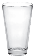
Conic 33 cl H 132 mm | Ø 80 mm