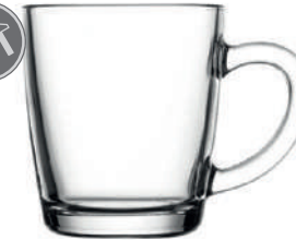
Malibu 34 cl H 98 mm | Ø 87 mm