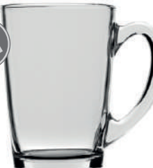
Morning 32 cl H 110 mm | Ø 80 mm