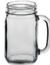
Country Jar - Deckel sortiert 48 cl H 134 mm | Ø 88 mm