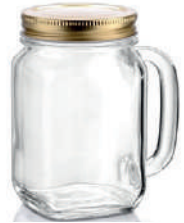
Country Jar - Deckel gold 48 cl H 134 mm | Ø 88 mm