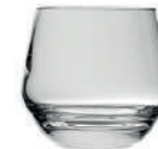
Lima 35 cl H 83 mm | Ø 94 mm