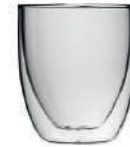
Bahia* 8 cl - Espresso H 65 mm | Ø 60 mm