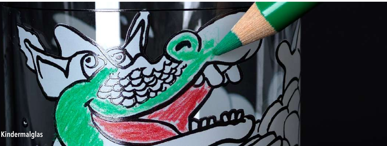
Painty - Kindermalglas