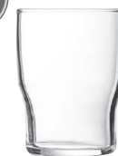
Campus 18 cl