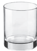
Timo 25 cl H 88 mm | Ø 73 mm