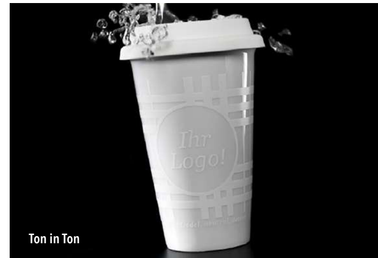
Ton in Ton