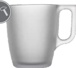
Nuevo satiniert 25 cl H 90 mm | Ø 75 mm