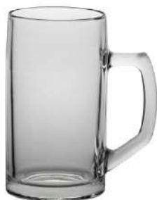
Brema glatt 0,5 l H 159 mm | Ø 86 mm