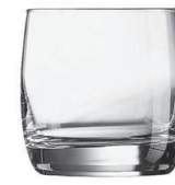
Vigne 31 cl H 83 mm | Ø 84 mm