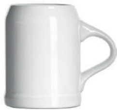
Glühweinsidel 6 24 cl H 100 mm | Ø 76 mm