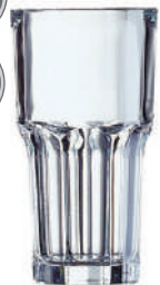
Granity 46 cl H 160 mm | Ø 87 mm