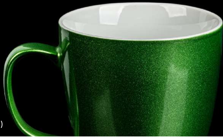
Color Dust (Beschichtung)