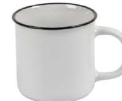
Vintage 5 26 cl H 83 mm | Ø 86 mm