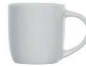
Olivia Espresso 8 cl H 56 mm | Ø 55 mm