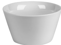
Kim Bowl 56 cl H 73 mm | Ø 131 mm