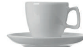
Pronto Espresso 10 cl H 59 mm | Ø 66 mm