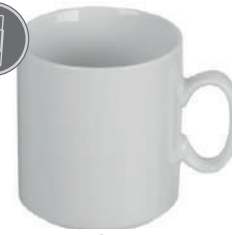
Würzburg 30 cl H 88 mm | Ø 80 mm