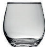
New Kalix 38 cl H 92 mm | Ø 89 mm