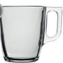
Nuevo 25 cl H 90 mm | Ø 75 mm