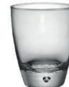
Santiago 108 mm 34 cl H 108 mm | Ø 87 mm