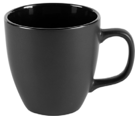
Apollo schwarz matt 43 cl H 100 mm | Ø 98 mm