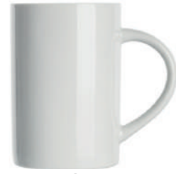
Carla 30 cl H 108 mm | Ø 73 mm