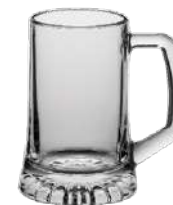
Sternboden 0,2 l H 123 mm | Ø 80 mm