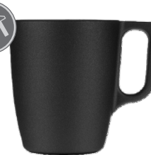
Nuevo 25 cl - schwarz matt metallic H 90 mm | Ø 75 mm