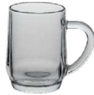
Weindorfseidel 28 cl H 103 mm | Ø 77 mm