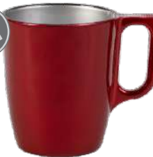
Nuevo 25 cl - rot galaxy H 90 mm | Ø 75 mm