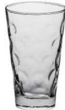
Dubbe 0,25 l H 128 mm | Ø 77 mm