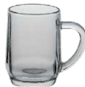
Haworth 0,5 l H 131 mm | Ø 93 mm