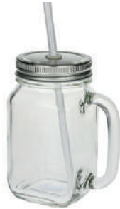
Country Jar - Deckel silber 48 cl H 134 mm | Ø 88 mm