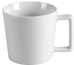
Kim 41 cl H 89 mm | Ø 97 mm