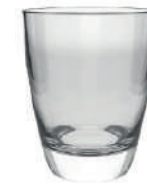
Manon 27 cl H 97 mm | Ø 80 mm