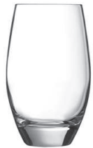
Malea 35 cl H 126 mm | Ø 76 mm