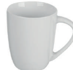
Raphael 30 cl H 98 mm | Ø 82 mm