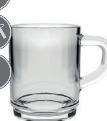
Henkelbecher 26 cl H 91 mm | Ø 72 mm