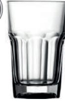
Harley 36 cl