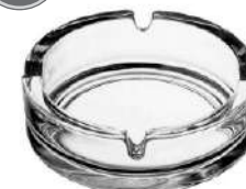
733 H 34 mm | Ø 107 mm