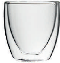
Bahia* 25 cl - Cappuccino H 98 mm | Ø 83 mm