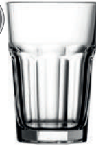
Harley 42 cl