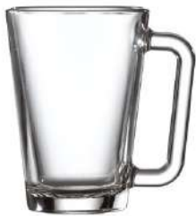
Venice 27,5 cl H 114 mm | Ø 79 mm