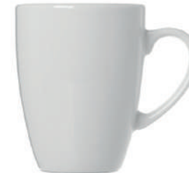
Bern 36 cl H 112 mm | Ø 85 mm