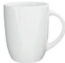
Opera 2 30 cl H 105 mm | Ø 82 mm