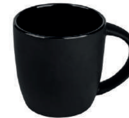
Olivia schwarz matt 36 cl H 89 mm | Ø 88 mm