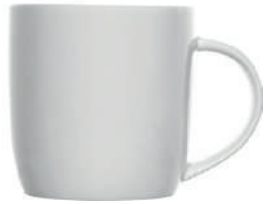
Olivia 36 cl H 89 mm | Ø 88 mm