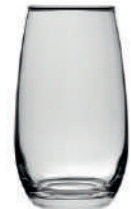
New Kalix 40 cl H 130 mm | Ø 75 mm