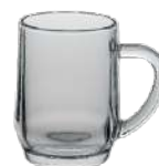
Haworth 0,25 l H 103 mm | Ø 78 mm