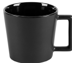
Kim schwarz matt 41 cl H 89 mm | Ø 97 mm