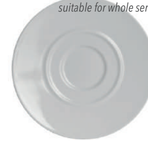
*passend für gesamte Serie suitable for whole series Olivia Untere H 17 mm | Ø 147 mm