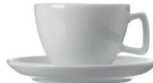
Pronto Cappuccino 20 cl H 67 mm | Ø 93 mm