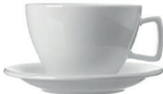
Pronto Café au Lait 40 cl H 77 mm | Ø 117 mm