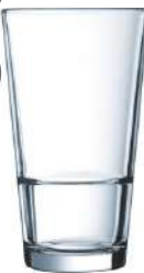
Stack Up 35 cl H 140 mm | Ø 78 mm