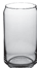
Vancouver 134 mm 47 cl H 134 mm | Ø 76 mm