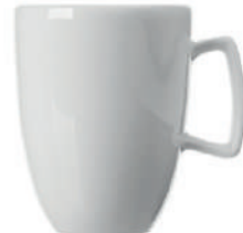
Pronto Kaffeebecher 25 cl H 97 mm | Ø 78 mm