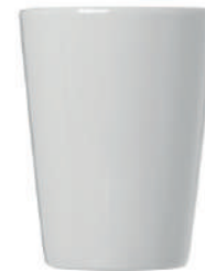
Tokio 35 cl H 108 mm | Ø 82 mm