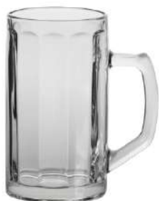
Brema Optik 0,5 l H 159 mm | Ø 86 mm