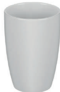
Indiana 50 cl H 131 mm | Ø 90 mm