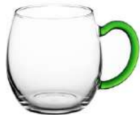
Weinseidel* 0,25 l H 84 mm | Ø 85 mm

*Borosilikat & neue Form | borosilicate & new shape