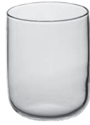
Ontario 27 cl