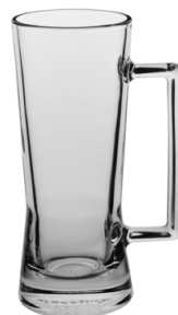
Glühwürmchen 24 cl H 160 mm | Ø 65 mm