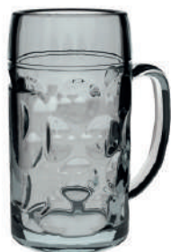
Isar 0,5 l H 160 mm | Ø 86 mm