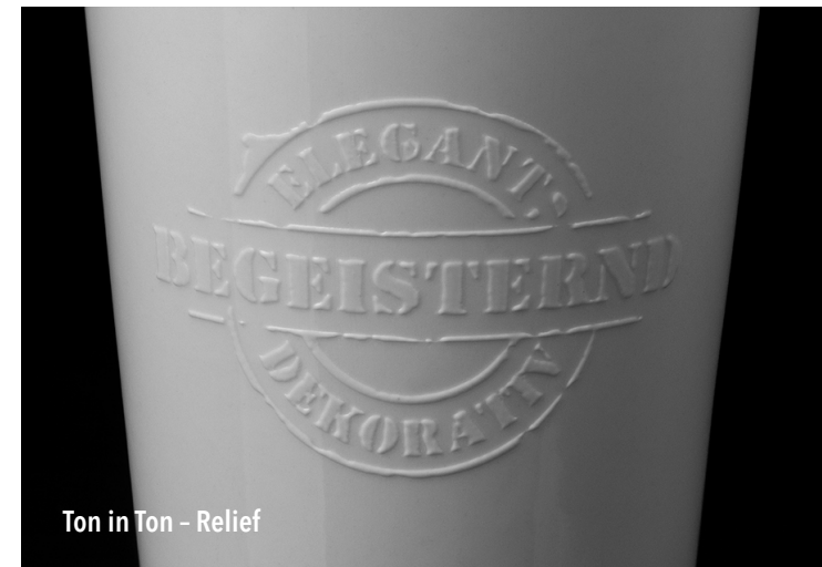
Ton in Ton - Relief