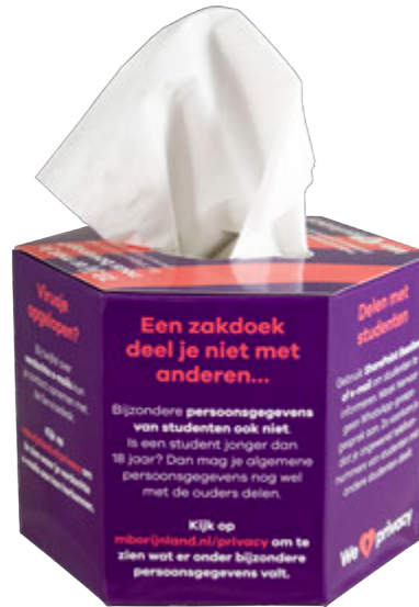
Tissue-Box Hexagon 9528

Beschreibung Hexagon Tissue-Box mit 100 Stück 3-lagigen Tissues Format 14 x 14 x 10 cm Bedruckung digital vollflächig Lieferzeit circa 4 Wochen nach Druckfreigabe