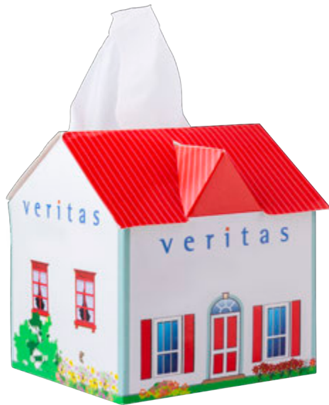
Tissue-Box Haus 9535

Beschreibung Haus Tissue-Box mit 50 Stück 3-lagigen Tissues Format 10,5 x 10,5 x 11,5 cm Bedruckung digital vollflächig Lieferzeit circa 4 Wochen nach Druckfreigabe