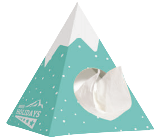
Tissue-Box Piramide 9540

Beschreibung Pyramide Tissue-Box mit 50 Stück 3-lagigen Tissues Format 14,5 x 14,5 x 18,5 cm Bedruckung digital vollflächig Lieferzeit circa 4 Wochen nach Druckfreigabe